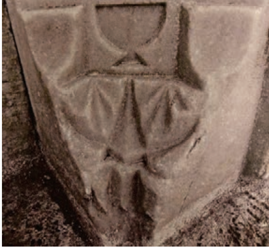
Fotoğraf 7. Kırşehir Cacabey Medresesi, süsleme, bağdaş kurup oturan hükümdar imgesi